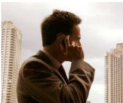
Diciembre 12, 2005